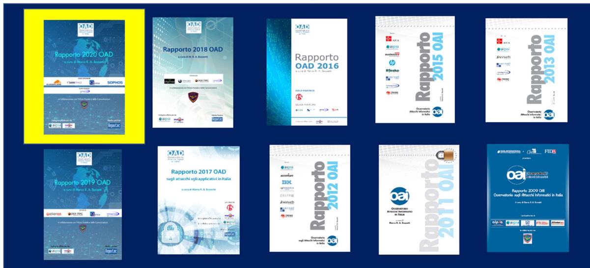
Fig. 1 Le copertine dei Rapporti OAD-OAI pubblicati

Con le varie edizioni di OAI e di OAD, è andato crescendo il numero di Patrocinatori, da varie libere associazioni del mondo ICT ad associazioni di categoria e di rappresentanza di Ordini, quali Assintel, Assolombarda, FiiF-CNF). I Patrocinatori consentono l'ampliamento del bacino dei possibili rispondenti al questionario annuale, oltre che dei lettori del Rapporto, ed è obiettivo di OAD di ampliare il numero di associazioni patrocinanti, per poter anche ampliare il numero di rispondenti e di lettori, soprattutto per i settori merceologici poco rispondenti, e quindi rappresentati, nelle precedenti edizioni.